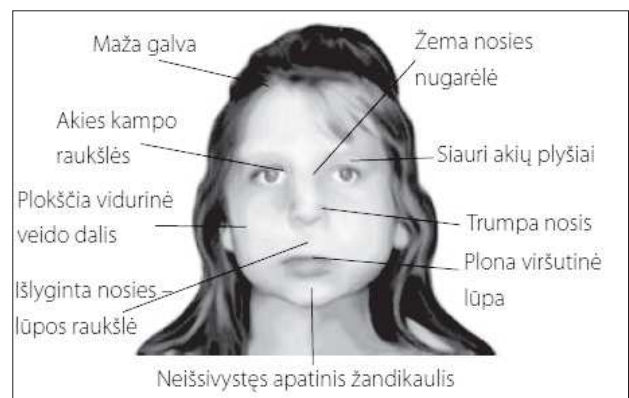
1a pav. VAS būdingi veido bruožai

1. Prenatalinis ir/arba postnatalinis augimo sulėtėjimas (svoris ir/arba ūgis mažesnis nei dešimtoji procentilė koreguotam gestaciniam amžiui). 2. Centrinės nervų sistemos (CNS) pokyčiai (neurologiniai sutrikimai, vystymosi sulėtėjimas, raidos sutrikimai arba deficitas, intelekto sutrikimas, smegenų struktūros pokyčiai, t.y. mikrocefalija (galvos apimtis mažiau trečiosios procentilės) arba galvos smegenų apsigimimai, nustatyti instrumentinių tyrimų ar autopsijos metu). 3. Būdingos veido anomalijos, nepriklausančios nei nuo rasinių, nei nuo etnografinių ypatybių: išlyginta nosies-lūpos raukšlė, plona viršutinė lūpa, siauri akių plyšiai ( \leq 10 procentilės), plokščia vidurinioji veido dalis,